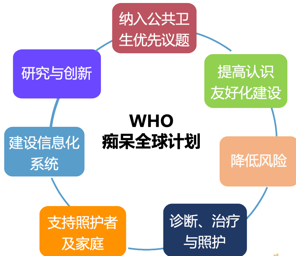
WHO. World Health Assembly. 2017