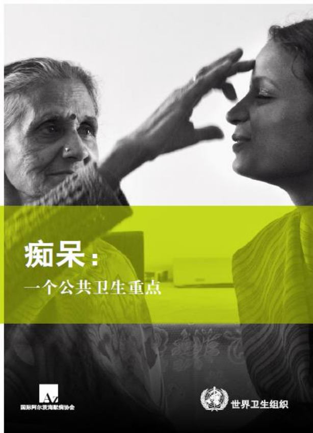
ADI. World Alzheimer Report 2015 (updated)